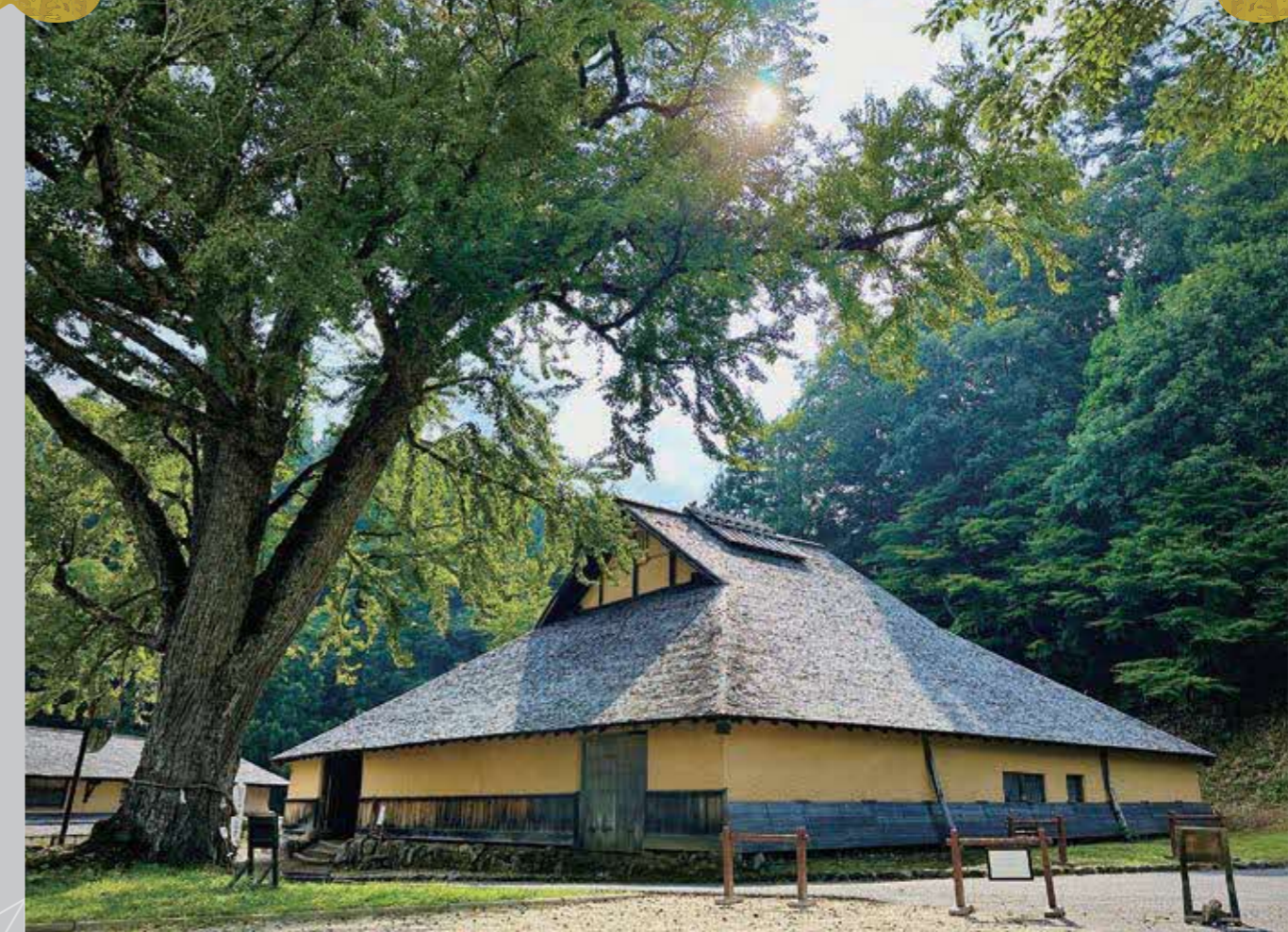
菅谷たたら山内 たたら製鉄を行っていた施設と、そこで働いていた人たちの集落が今も残っています。 国指定重要有形民俗文化財 日本遺産構成文化財