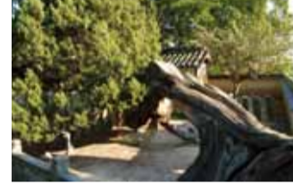
光明坊の県天然記念物「イブキヤクシン」