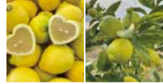
せとだエコレモン® グリーンレモン