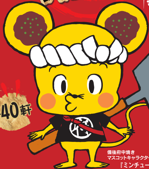
備後府中焼き マスコットキャラクター 『ミンチュウ』