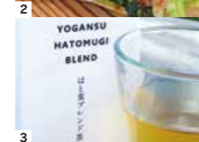
1. 焼きたてパン 2. パニーニ 3. はとむぎブレンド茶