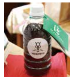
よがんすオリジナルブレンドコーヒー