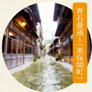
青石畳通り(美保関町)